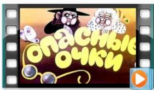
[v-s.mob]Опасные очки начитанный диафильм.mp4